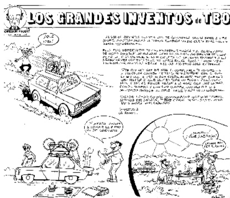
El professor Franz de Copenhague va ser Sabatés 57 anys