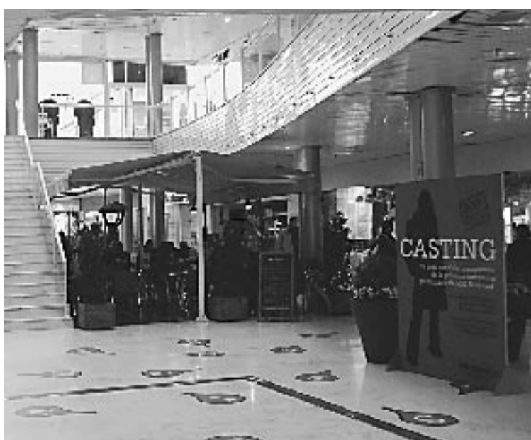
El càsting ja s'anuncia al centre comercial de l'Eix Macià